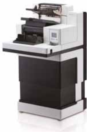
Kodak i5850S Scanner

Heutzutage sind Business Process Outsourcers (BPOs) und Dienstleistungsunternehmen mit immer stärkerer Konkurrenz und einem steigenden Druck zur Senkung der Gesamtkosten konfrontiert. Bei der Dokumentenerfassung können die manuelle Vor- und Nachbearbeitung von Scanprozessen bis zu 75% der gesamten Scankosten oder mehr ausmachen. Die Verringerung dieser Ausgaben bei gleichzeitiger Steigerung der Produktivität ist entscheidend. Die Kodak i5650S und i5850S Scanner optimieren die Vorgänge bei der Handhabung gemischter Stapel und bei komplexen Scananwendungen sowie den damit verbundenen Herausforderungen.