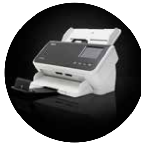
Alaris S2060w/S2080w Scanner