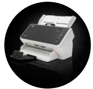
Alaris S2050/S2070 Scanner